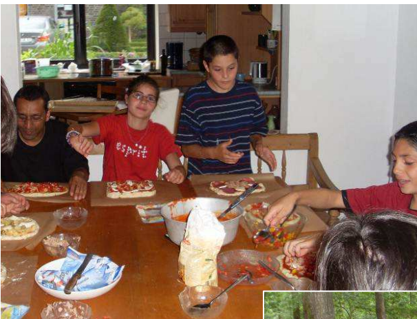
Gatitul in comun de pizza

Deosebit de frumos a fost pentru unii dintre sponzorii din zona, sa-i cunoasca pe copii pentru care o parte dintre ei doneaza, se roaga sau se ingrijesc in alt fel deja de multi ani. La o dupa-masa cu cafea. Pentru copiii insusi excursia in Germania a fost un eveniment mare si palpitant, pe care l-au asteptat cu bucurie de mult timp.